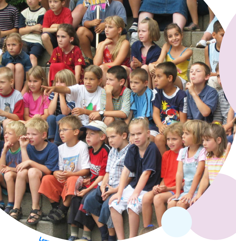
Lernen in der Gemeinschaft

„Die Umgangskultur entsteht von innen heraus.“