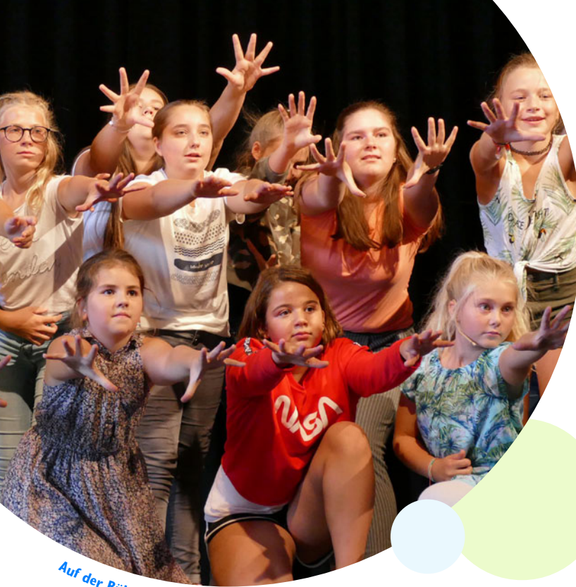
Auf der Bühne für das Leben lernen