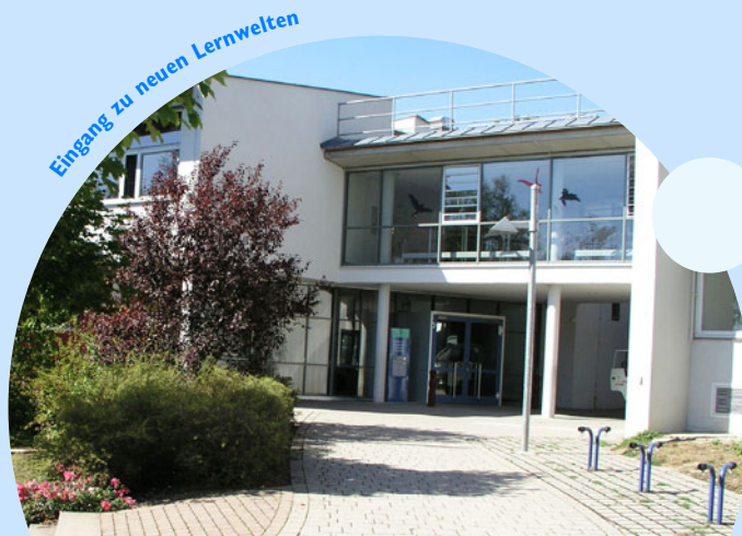
Eingang zu neuen Lernwelten

Der Dialog über Erziehung und eine gute Vorbereitung für den weiteren Lebensweg der Kinder wird an unserer Schule innerhalb der Schulgemeinschaft und mit externen Fachleuten geführt. Dabei sind wir offen für Impulse, die unser Schulleben weiter bringen.