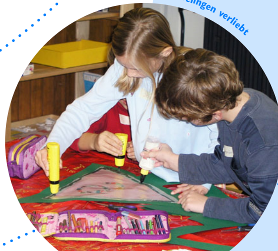
Ins Gelingen verliebt