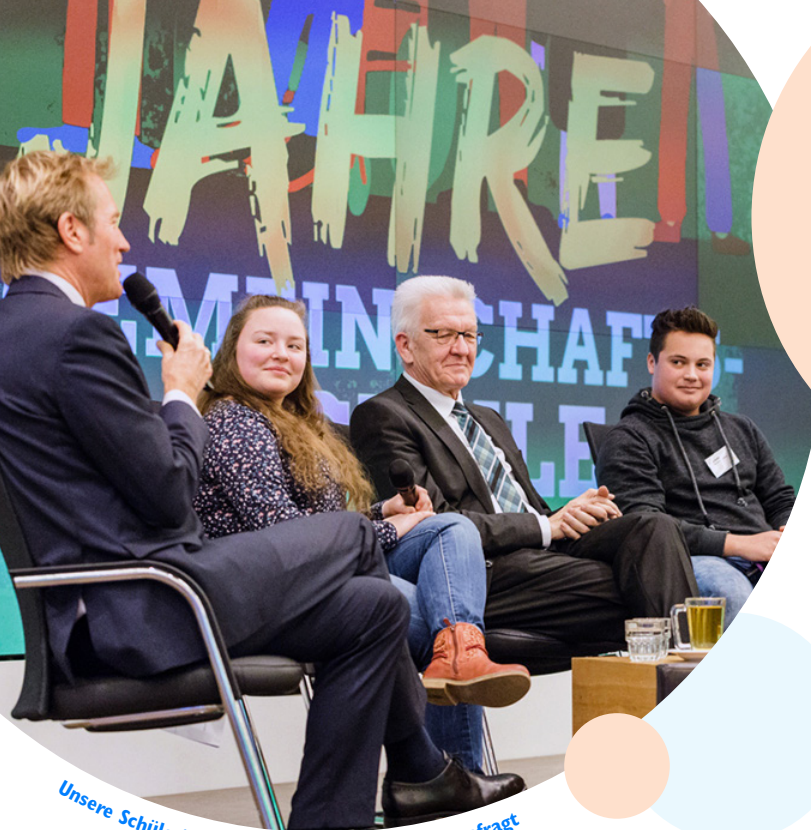
Unsere Schülerinnen und Schüler sind überall gefragt

„Wir verankern unsere Schulentwicklung in unserem sozialen, kulturellen, wirtschaftlichen und politischen Umfeld und stehen so mitten im Leben.“