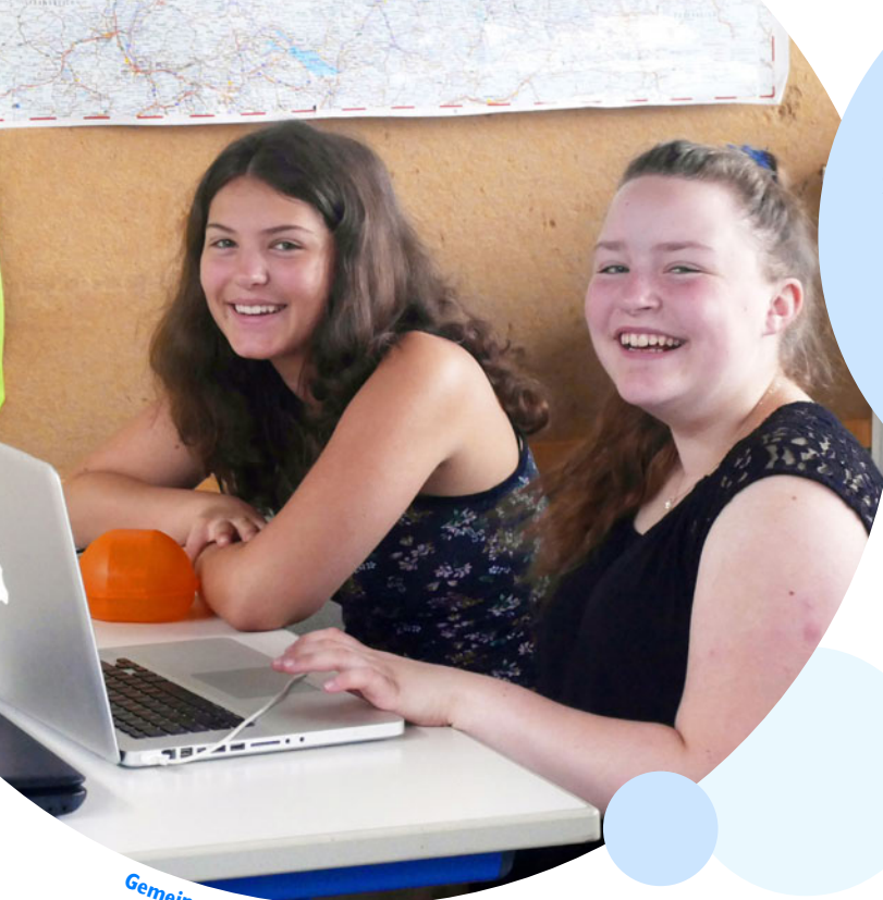
Gemeinsames Lernen bereichert

„Durch unsere klaren Planungszyklen vergessen wir weniger und haben eine bessere Vorstellung, was passiert.“