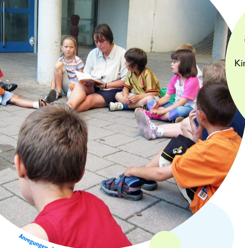
Anregungen durch ungewöhnliche Lernorte

„Unsere Lehrerinnen und Lehrer haben echtes Interesse an den Kindern und wollen, dass sie eine gute Schulerfahrung haben.“