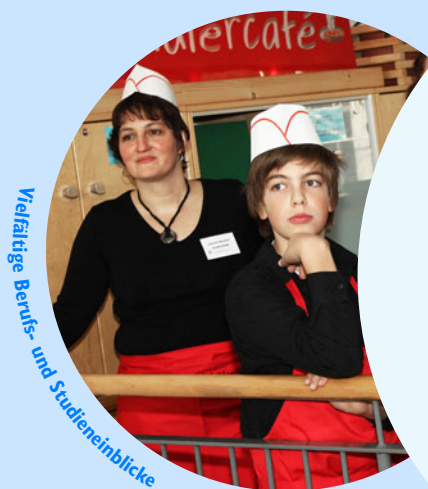
Vierfältige Berufs- und Studieneinblicke

Jedes Jahr gibt es zahlreiche Aktivitäten und Angebote, die unsere Schülerinnen und Schüler mit dem geliebten Alltag verschiedenster Berufe in Kontakt bringen. Die Palette variiert von Jahr zu Jahr durch aktuelle Programme sowie konkrete Kooperationsprojekte mit der Wirtschaft. Berufspraktika in den Jahrgangsstufen 8 und 9 sind für die Gemeinschaftsschule fest in den Bildungsplan integriert und werden von unseren Lernbegleitern mit den Kindern intensiv vorbereitet und betreut.